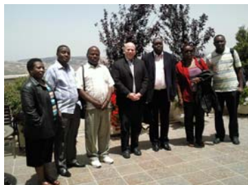
משלחת עובדי ממשל מטנזניה בביקור בלשכה

פרט לכך מגיעים ללמ"ס "אורחים לרגע" המתעניינים בפעילות המבוצעת בלשכה ובמידע סטטיסטי על מדינת ישראל.