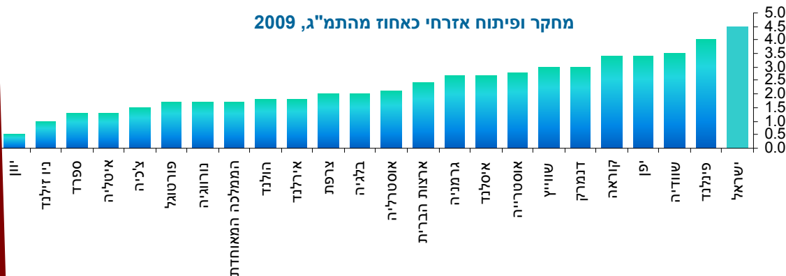
מחקר ופיתוח אזרחי כאחוז מהתמ"ג, 2009

ישראל נתפסת כמשק חדשני המושתת על מדע וטכנולוגיה, והיא מובילה בעולם כולו בשיעור ההוצאה הלאומית למחקר ופיתוח אזרחי מתוך התמ"ג. גם בנושא החדשנות הטכנולוגית ישראל ניצבת בין המדינות המובילות בעולם, ובה 37% מהחברות עוסקות בחדשנות טכנולוגית ו-70% מהחברות (השיעור הגבוה ביותר) עוסקות בחדשנות בכלל.