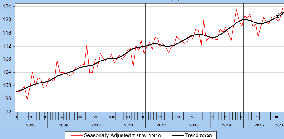
לנתוני תרשים 1